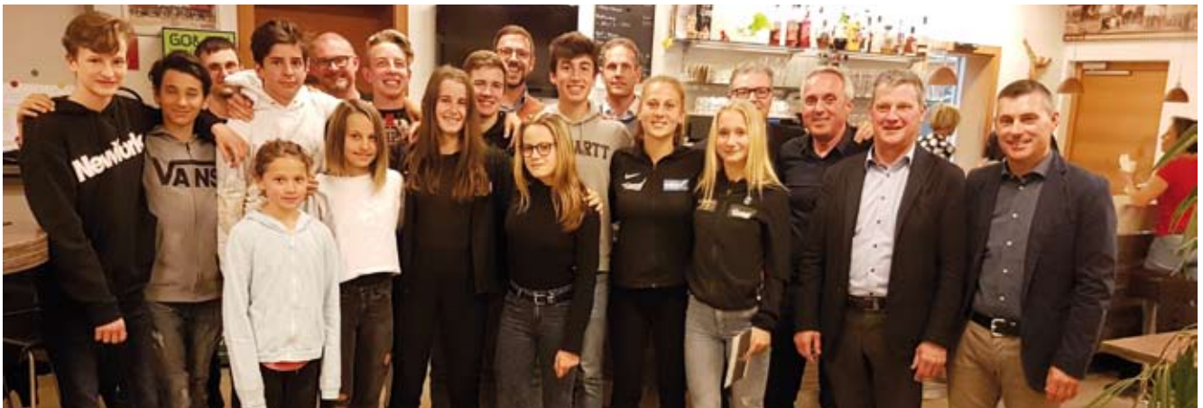
Einige Prämierte bei der Vollversammlung

Über sportliche Erfolge und gesunde Finanzen darf sich der TC Rungg freuen. Bei der Vollversammlung wurde auch das laufende Bauprojekt vorgestellt.