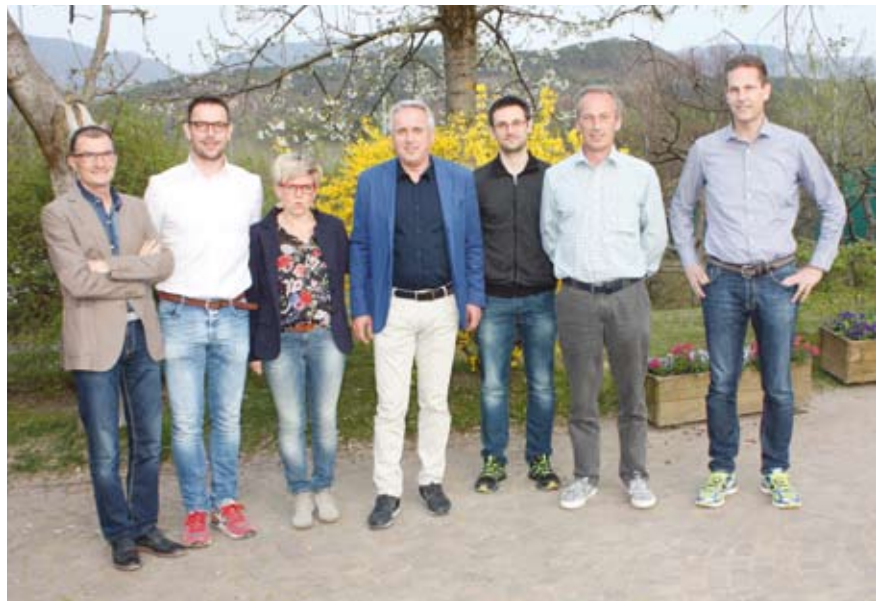
Der amtierende Vorstand des TC Rungg: am 3. April wird neu gewählt.

Auch stehen heuer Neuwahlen an. Die anwesenden Mitglieder wählen