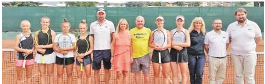
Das Rungger Unter-16-Mädchenteam (ganz links) mit den Finalgegnerinnen von ATA Battisti Trient

Damit gehören die Rungger Unter-16-Mädchen zu den besten acht Teams Italiens und spielen vom 28. bis 30. September im Adriaort Cervia um den Italienmeistertitel. Zur Erinnerung: Vor zwei Jahren qualifizier-